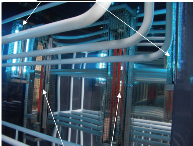
遠赤外線ヒーター